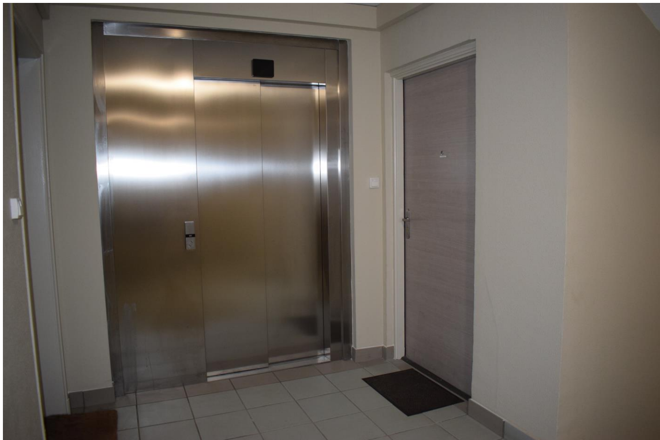
Nouvelle porte palière