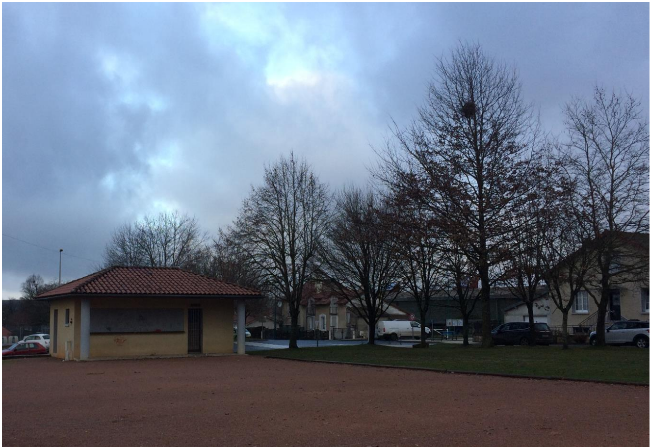
3/ Salle seniors